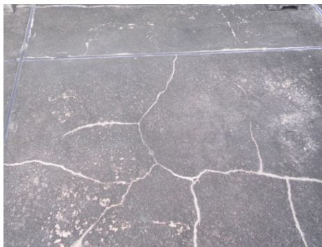
屋上のシーリング工事(例)

2015年7月の台風11号で長期的な雨が降り続きました。その結果、大きな事故はなかったとはいえ、入居者様より数件、雨漏れ報告を頂きました。今回の報告は、屋上よりも窓枠のシーリングの劣化と見られる雨漏れが多かったように感じます。「屋上は最近、防水工事をしたから大丈夫！！」でも外壁防水は実施していますか。屋根や外壁の防水は、10年～15年と言われております。今一度、この機会に再確認をして頂くことで、リクスマネージメントが出来ると考えております。