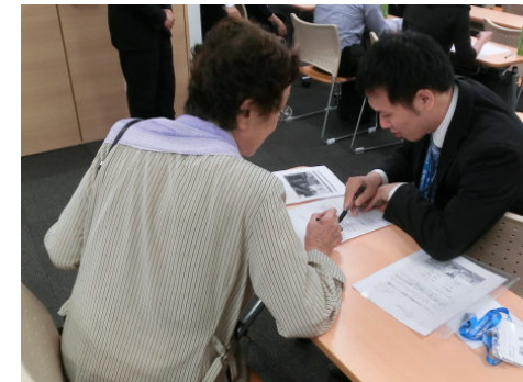
セミナー後の個別相談の様子